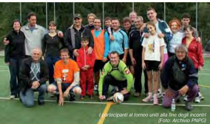
I partecipanti al torneo uniti alla fine degli incontri

RESIUTTA. - La squadra del Parco delle Prealpi Giulie si è affermata nella prima edizione di "Ce balon!", torneo di calchetto fra i rappresentanti delle aree protette della montagna friulana. L'iniziativa si è svolta nei giorni scorsi a Resiutta ed ha visto partecipare, oltre ai vincitori, le squadre del Parco delle Dolomiti Friulane e delle Riserve della Val Alba e della Forra del Cellina. Il regolamento della manifestazione prevedeva che ogni compagine