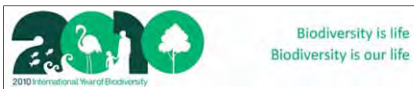
Il logo ufficiale dell'anno internazionale

Il 20 dicembre 2006, l'Assemblea Generale delle Nazioni Unite ha proclamato il 2010 Anno Internazionale della Biodiversità. Ha inoltre invitato il segretariato a collaborare con le agenzie delle Nazioni Unite interessate, le organizzazioni internazionali e gli altri attori che si occupano di ambiente per dare maggiore attenzione a livello internazionale alla continua perdita di biodiversità.