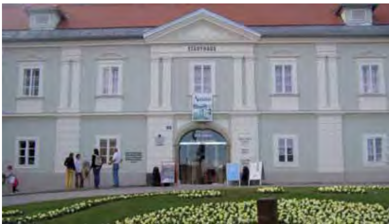
La Stadthaus di Klagenfurt