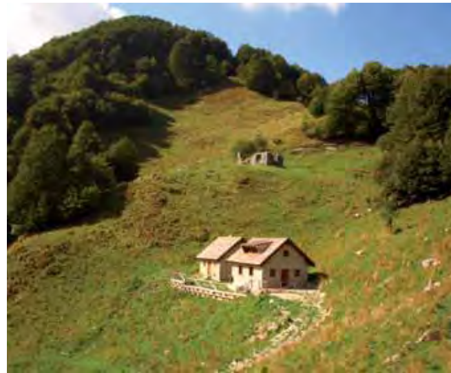
La zona di Casera Nischuarch è una delle preferite dai cervi presenti nel Parco