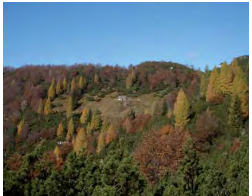
Casera Crostis in Val Alba

In alcuni processi partecipativi vengono coinvolti i portatori d'interesse tematici, ossia le persone che hanno diretto interesse nei temi che sono centrali nel progetto (es. agricoltura, turismo, ecc.). In altri invece, oltre ai portatori di interesse tematico, si coinvolge tutta la popolazione che viene