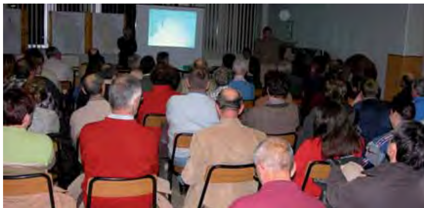
La partecipazione durante il progetto IPAM Toolbox "Una riserva per la Val Alba"

consultata riguardano tematiche e problematiche più vaste e generali (es. stesura di una legge regionale in Toscana).