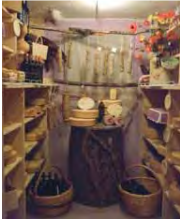
La fornita cantina della "Taverna Ai Musi"

RESIA. - Il Marchio del Parco mira a promuovere le attività produttive del territorio della nostra area protetta in grado di fare sistema ed offrire prodotti e servizi di qualità. Continuando a sostenere il rapporto che lega l'Ente parco agli operatori economici del territorio, la certificazione viene concessa a quei servizi, attività e prodotti, che hanno sede nei comuni interessati dall'area protetta e che rispondono a specifici criteri ecologici, ambientali e prestazionali. Nel concreto i discipli-