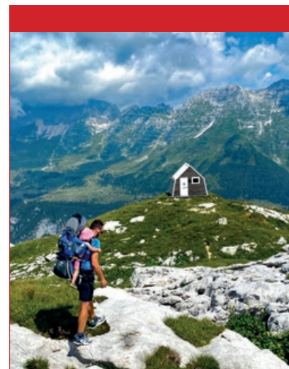
Al parco in famiglia