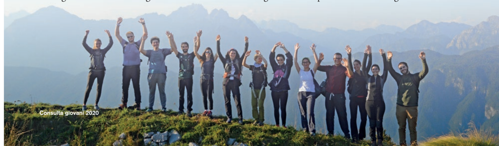
Consulta giovani 2020